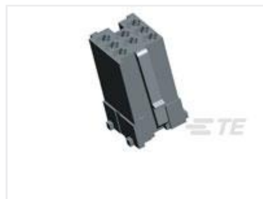
TE 产品编号 493487-1 HSG 8 POSN. MICROTIMER REC.