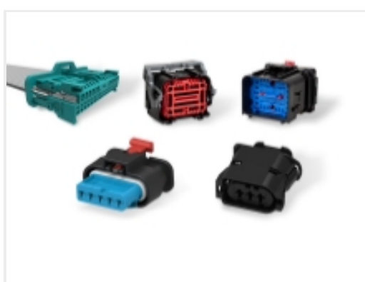
Automotive Signal & Power Connector Housings(3)