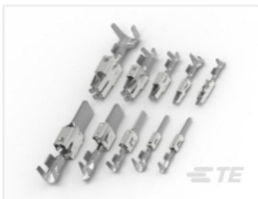
TE 产品编号 CAT-T4827-T273 定时器，母端和公端