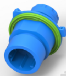
TE 产品编号CAT-C4962-CH8172 Circular DIN Housings