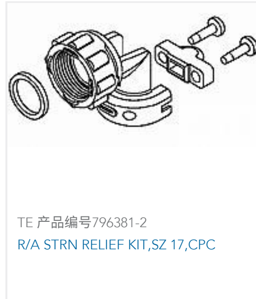
TE 产品编号796381-2 R/A STRN RELIEF KIT, SZ 17, CPC