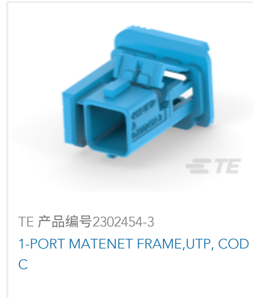
TE 产品编号2302454-3 1-PORT MATENET FRAME, UTP, COD C