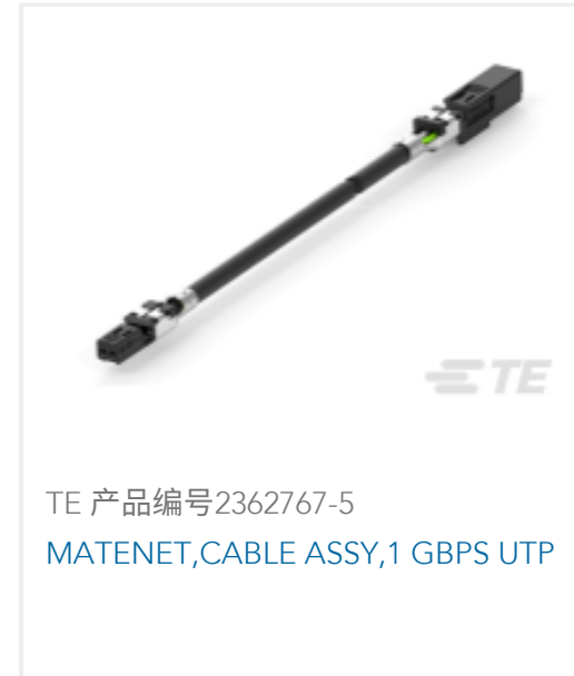
TE 产品编号2362767-5 MATENET, CABLE ASSY, 1 GBPS UTP