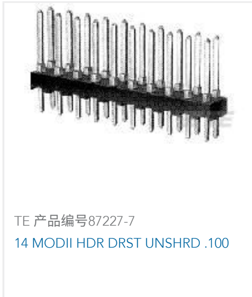
TE 产品编号87227-7 14 MODII HDR DRST UNSHRD .100