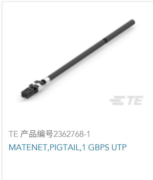
TE 产品编号2362768-1 MATENET, PIGTAIL, 1 GBPS UTP