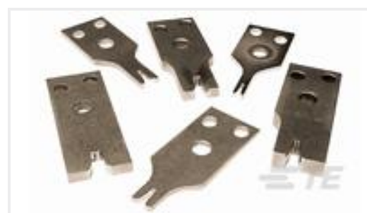
TE 产品编号1-1633961-2 CRIMPER, INSULATION F PREMIUM