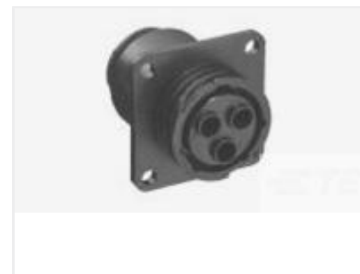
TE 产品编号788189-2 CPC 17-3 RCPT ASY,REV SEX