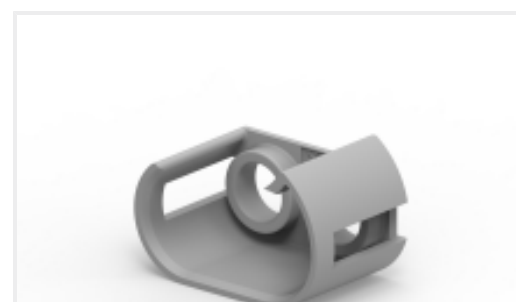
TE 产品编号1587940-3 CABLE SEAL RETAINER, SIZE C