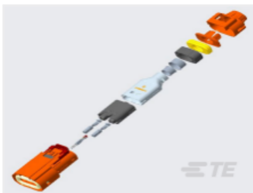
TE 产品编号YHV280-2PM-P-4MM-B HVA280-2phm,pass,4sqmm,Key B