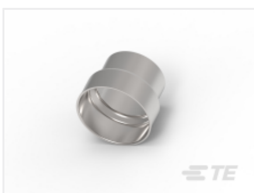
TE 产品编号2177090-3 STEEL, OUTER FERRULE, 8MM HV, 25SQMM