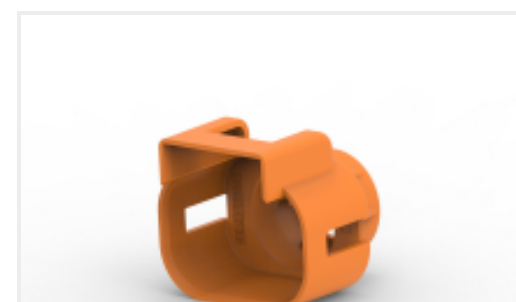
TE 产品编号2103013-3 CABLE SEAL RETAINER, SIZE 2, OR, HVA280