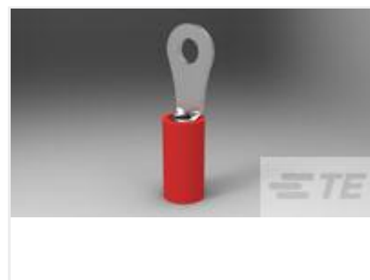
TE 产品编号2-330648-1 PIDG 22-16 22-18 MIL R 4; TAPE