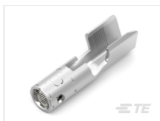
TE 产品编号2208669-3 8MM HV, CONTACT, ASSY